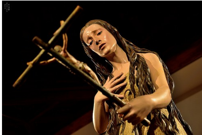
Magdalena Penitente (Pedro de Mena)

En el siglo XVIII, Francisco Salzillo (1707-1783). Es el más representativo de la imaginería española del siglo XVIII. Trabajó en Murcia, y tiene un estilo de transición desde el Barroco hacia el Rococó y el Neoclasicismo. Su obra es esencialmente religiosa, destacando el Belén, imágenes para procesiones, como Oración del Huerto, La Caída, San Juan, La Dolorosa, Santa Verónica, etc. Realizó las imágenes de los cuatro santos de Cartagena: San Fulgencio, San Isidoro, Santa Florentina y San Leandro. Trabajaba en madera policromada, influenciado por maestros como Bernini, llegó a una gran perfección, idealizaba la belleza frente al dramatismo y buscaba la elegancia y el naturalismo. Además, Salzillo desarrolló la técnica del estofado (de orígenes góticos, que se utilizaba para marcar los pliegues de la ropa, donde se colocaba un plancha de oro, plata o cobre, se recubría de pintura y con el raspado se hacían dibujos y filigranas, quedando descubierto el oro, la plata o el cobre. En su taller, llegó a haber una gran especialización, unos se dedicaban a elaborar pelucas con cabello natural, otros pestañas, ojos, manos, etc. Además, creó modelos de imágenes para vestir, donde sólo se esculpía la cabeza, manos y pies.